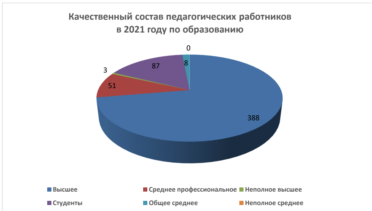
Диаграмма 2. Соотношение состава педагогических работников по образованию